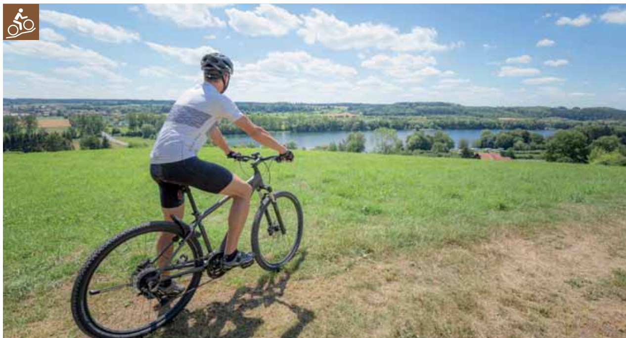
Blick auf die Zielfinger Seen