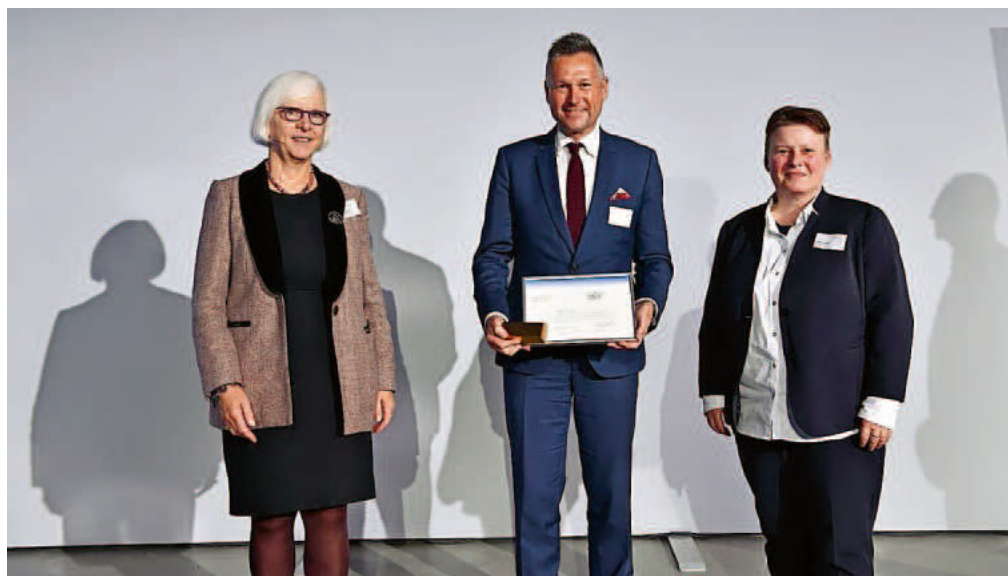
Preisverleihung; Bildquelle: Association European Energy Award

Rund 150 Teilnehmende aus mehreren europäischen Ländern waren vor Ort in Ravensburg anwesend, um die verdiente Auszeichnung mit dem European Energy Award Gold entgegenzunehmen. Weitere 70 Teilnehmende folgten der Veranstaltung digital. Aus Baden-Württemberg wurden folgende 15 Kommunen