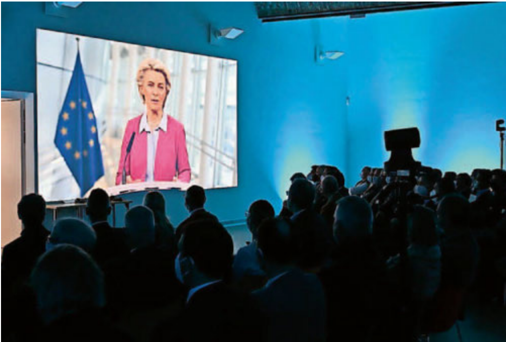
Preisverleihung