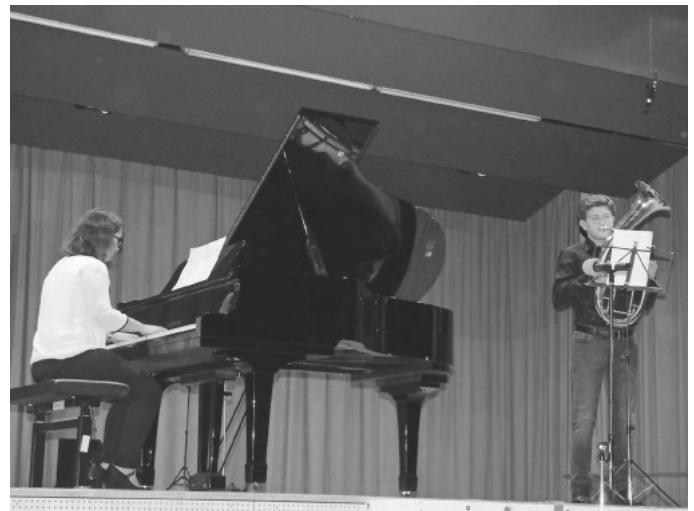
Bilder: Jahreskonzert 2018