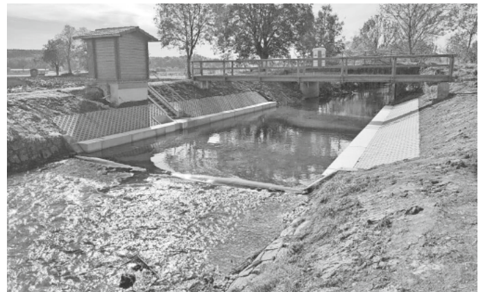
Pegelanlage Ennetacher Ablach; Foto: Manfred Bleile, Regierungspräsidium Tübingen.

Die Wasserstands-Daten werden kontinuierlich in Echtzeit über Winkelcodierer erfasst und mittels zweier unabhängiger Meldesysteme per Datenfernübertragung an die Hochwasservorhersagezentrale in Karlsruhe übermittelt. Die Daten können auf der Internet-Seite der Landesanstalt für Umwelt unter Hochwasservorhersagezentrale Baden-Württemberg ( baden-wuerttemberg.de ) eingesehen und abgerufen werden. Der mittlere langjährige Niedrigwasserabfluss beträgt dort 1.400 Liter pro Sekunde, kann aber bei einem 100-jährigen Hochwasser innerhalb kurzer Zeit auf 65.000 Liter pro Sekunde ansteigen. Die Pegel sind daher eine wichtige wasserwirtschaftliche Einrichtung zur Hochwasserermittlung, um Anlieger rechtzeitig vor Gefahren warnen zu können.