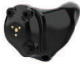
Livio AI R von Starkey