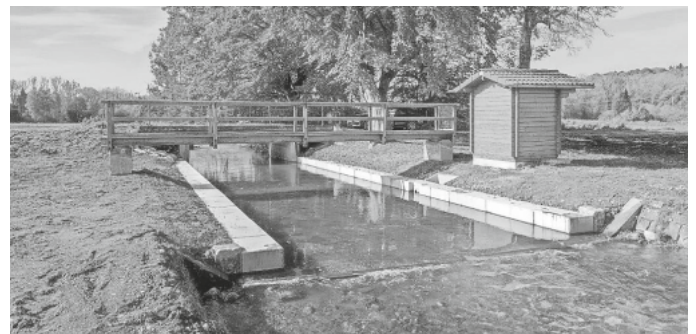
Pegelanlage Mengener Ablach; Foto: Manfred Bleile, Regierungspräsidium Tübingen.