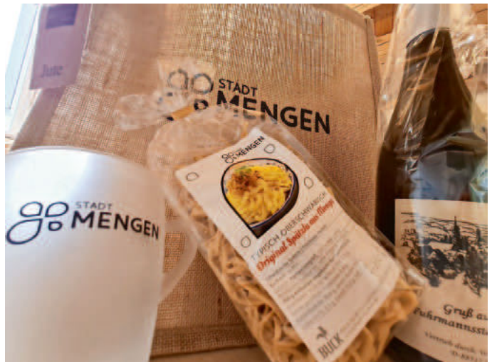
Foto: Das Gewinnerfoto wird mit einer Geschenktasche der Stadt Mengen belohnt (Stadt Mengen)

Dann senden Sie uns Ihr Foto, bitte nur im Querformat und mit einer guten Auflösung, jeweils bis zum 7. des Folgemonats an presse@mengen.de . Bitte geben Sie neben Ihrem Namen auch Ihre Kontaktdaten (für den Gewinn) sowie eine Bildbezeichnung, das Aufnahmedatum und den Ort der Aufnahme an. Alle eingesandten Fotos müssen einen Bezug zu Mengen haben und vom/von der Einsender*in selbst aufgenommen worden sein. Mit dem Einsenden des Fotos und der Teilnahme am Wettbewerb gehen sämtliche Rechte am Foto an die Stadt Mengen über, auch gegenüber Dritten. Für Fragen steht Ihnen gerne Frau Kerstin Keppler unter Tel.: 075 72 / 607 – 503 oder per E-Mail: presse@mengen.de zur Verfügung. Und nun viel Spaß beim Knipsen – wir freuen uns über zahlreiche Einsendungen!