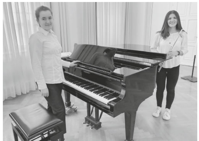
Auch Teilnehmer des diesjährigen „Jugend musiziert“ Wettbewerbs werden beim Konzert zu hören sein.