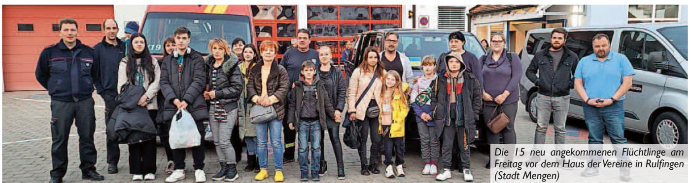
Die 15 neu angekommenen Flüchtlinge am Freitag vor dem Haus der Vereine in Rulfingen (Stadt Mengen)