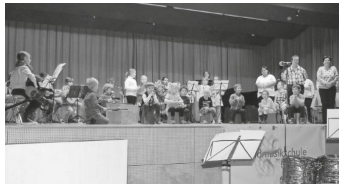
Kinder der Elementar- und Blockflötenklasse zeigen ihr Können beim Jahreskonzert.

Ebenfalls möchten wir auf die Maskenpflicht (FFP2 Maske ab 18 Jahren) ab einem Alter von 6 Jahren mit den Ausnahmen des § 3 Absatz 3 & 4 Corona VO hinweisen.