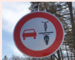
Ein neues Verkehrszeichen zum Überholverbot von einspurigen Fahrzeugen kommt in der Praxis bereits zum Einsatz.

Weitere Informationen zu der Studie erhalten Sie unter https://www.agfk-bw.de/presse/news-single/modellvorhaben-zum-ueberholabstand-laeuft-an-agfk-und-hka-arbeiten-an-massnahmen-zur-verbesserung-der/vom/313/2022/